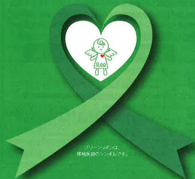
グリーンリボンは、 移植医療のシンボルです。